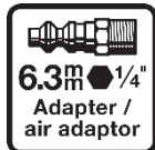
Raccord d'air comprimé

Les symboles ci-dessous sont attachés à l'appareil / à l'emballage et ont les significations suivantes: